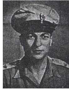
زكريا محي الدين